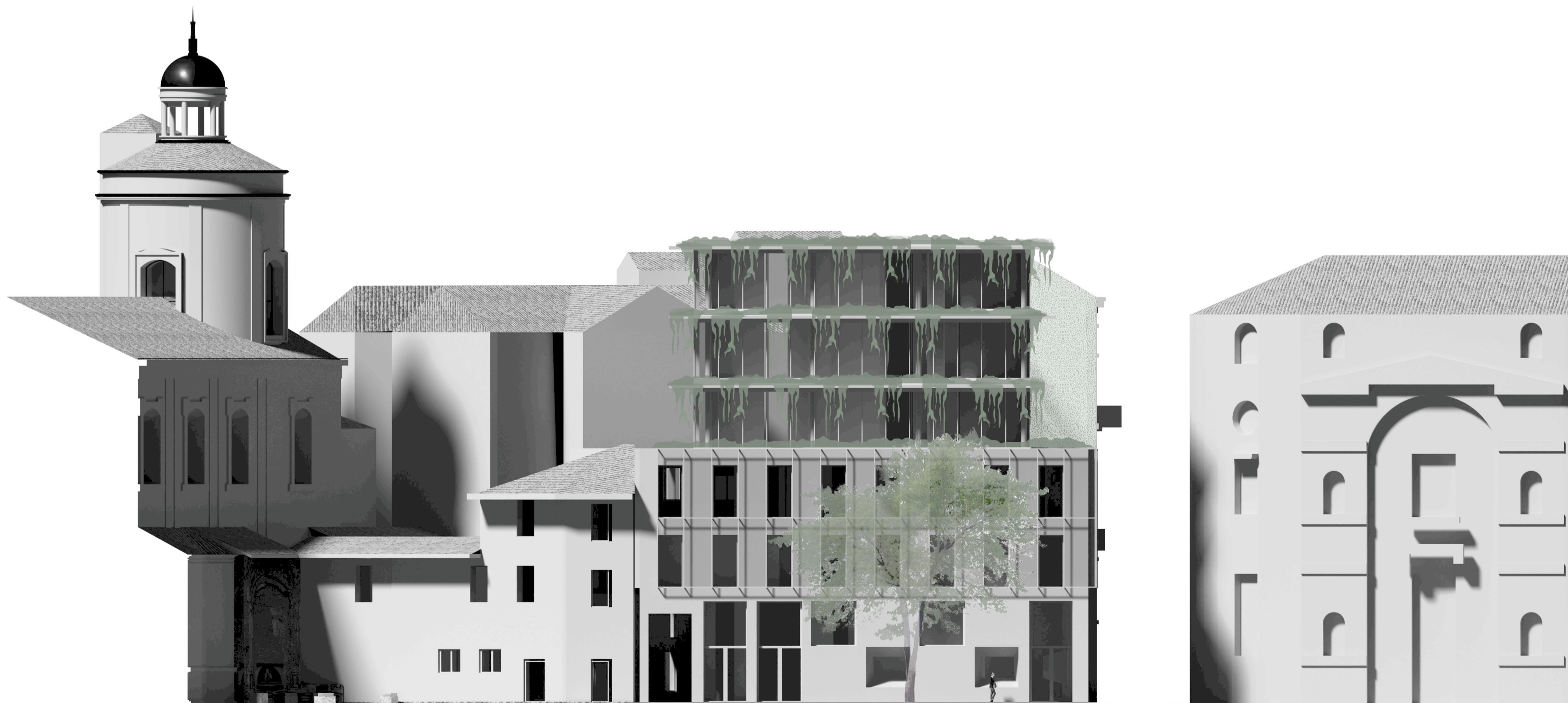
Prospetto Sud - Vicolo di Santa Maria alla Porta - 1:200