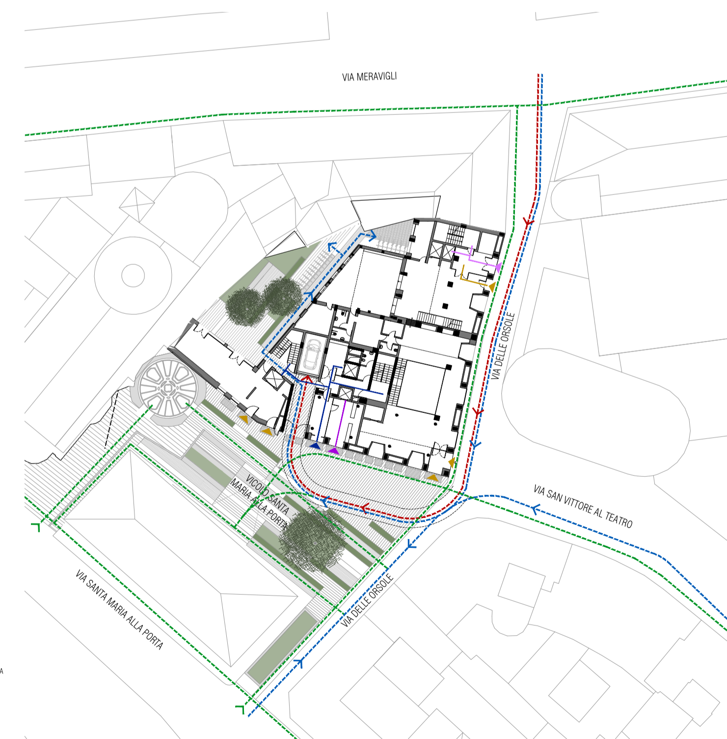
Planimetria generale - 1:500