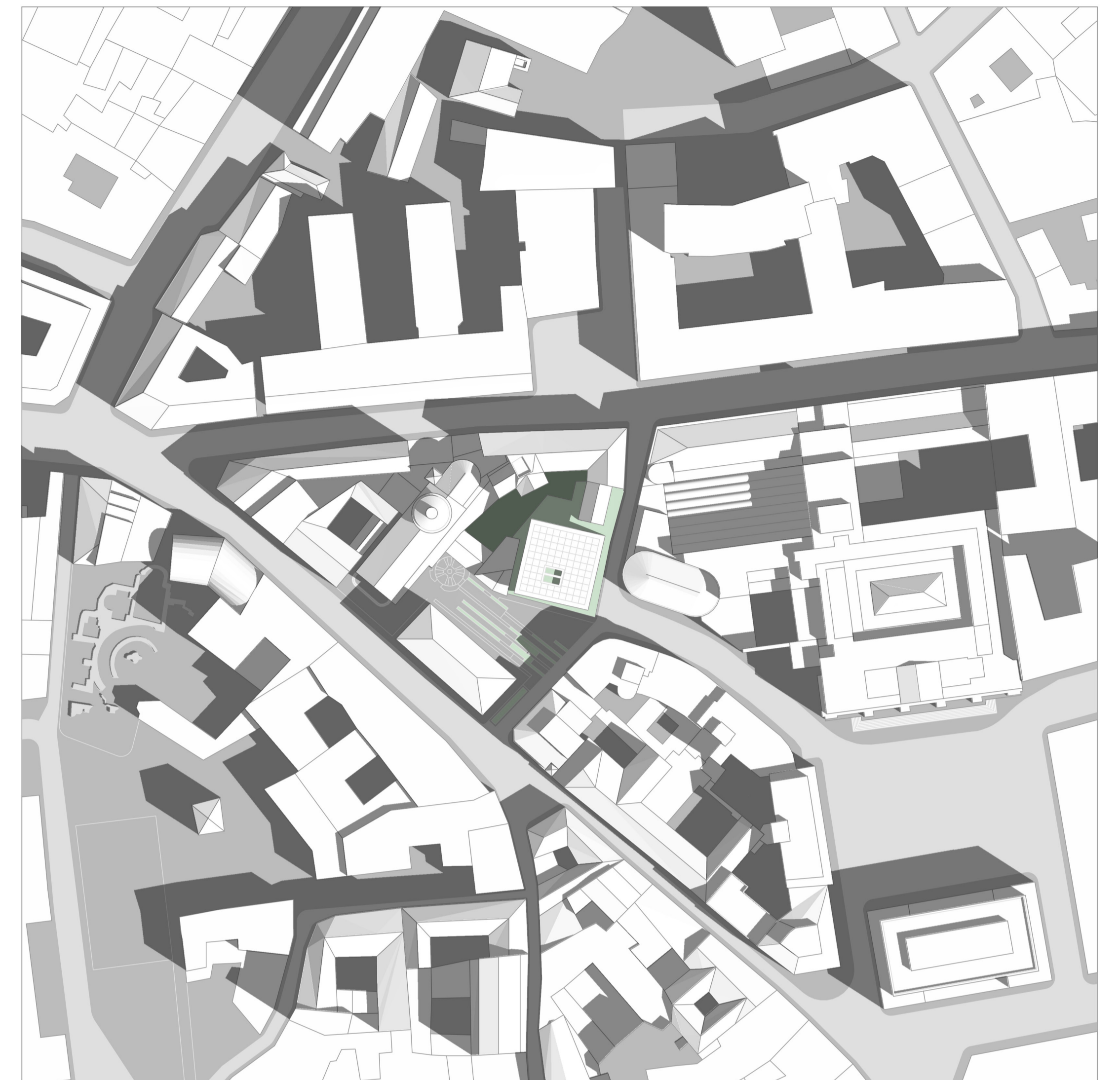
Inquadramento urbano - 1:1000