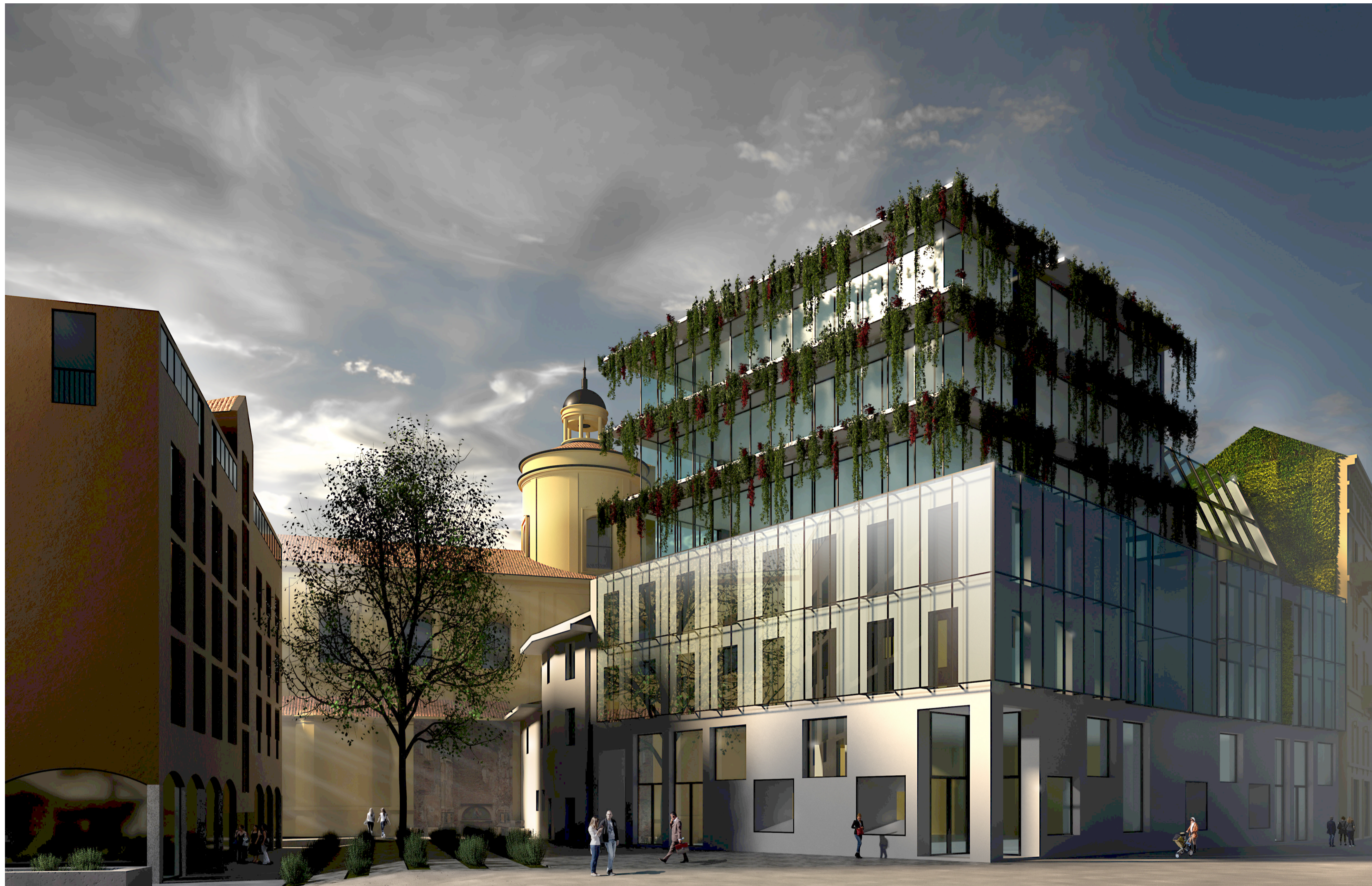
Vista da Vicolo di Santa Maria alla Porta