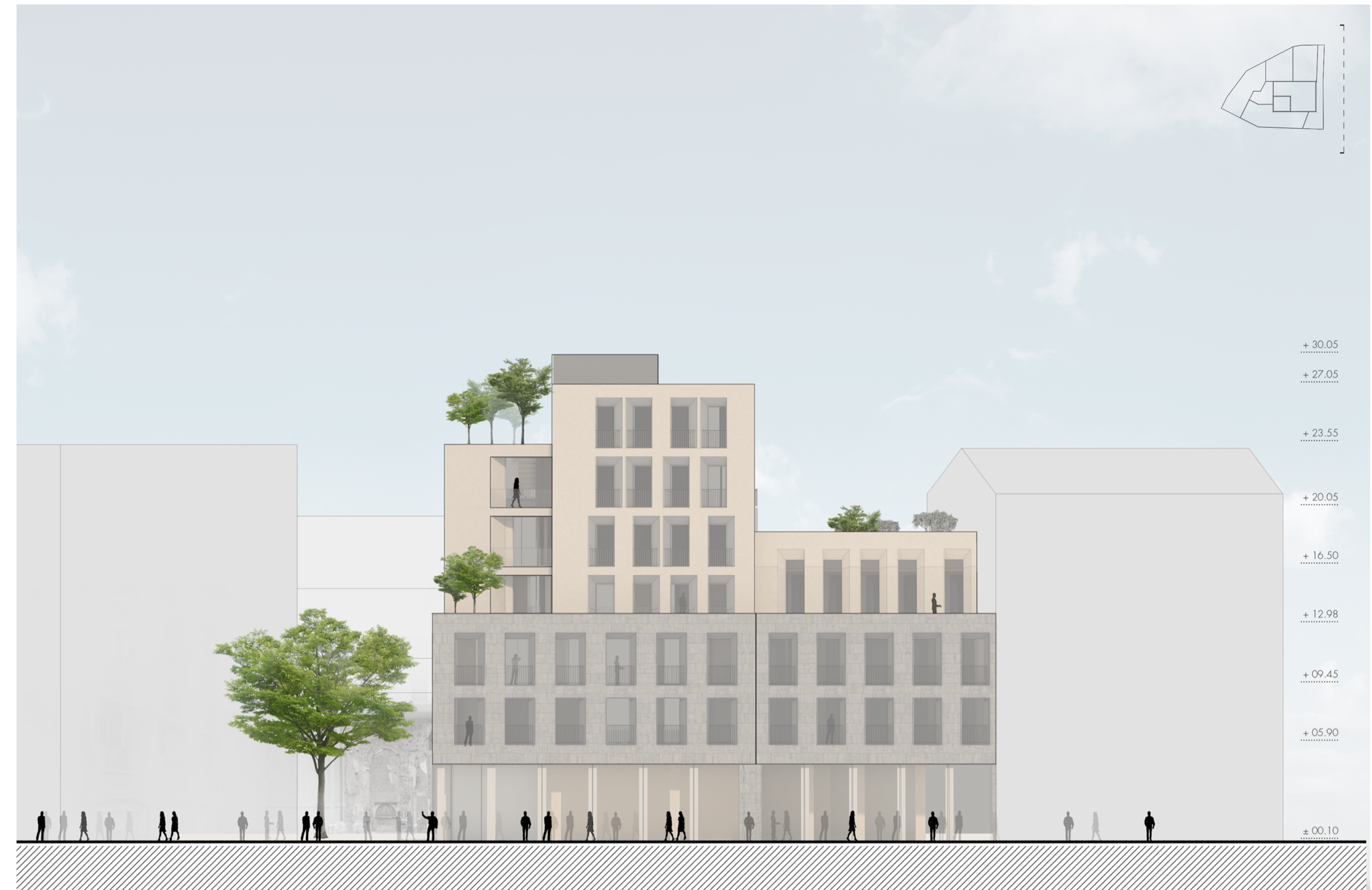
Prospetto est 1:200