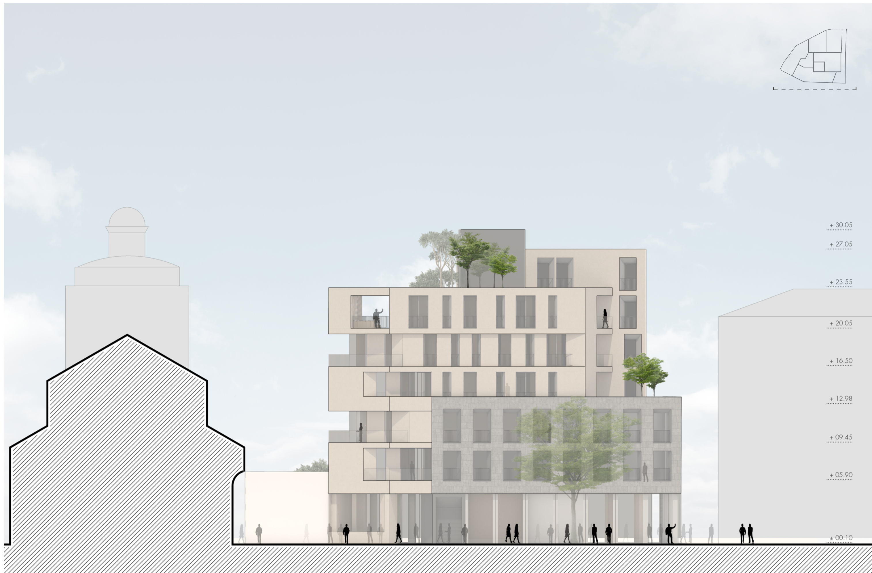
Prospetto sud 1:200