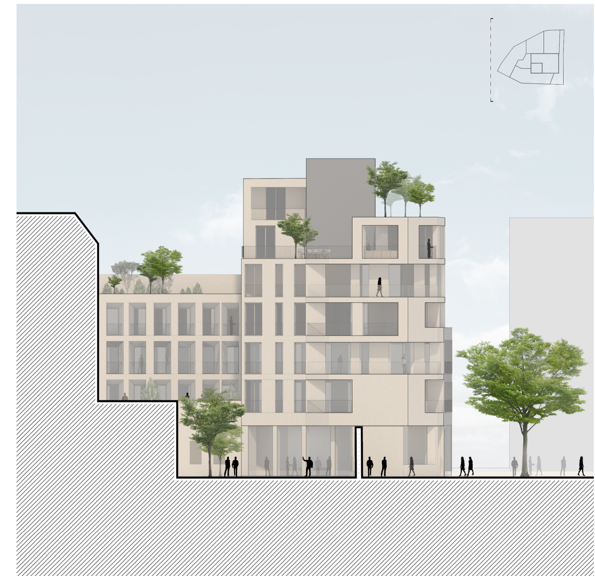
Prospetto ovest 1:200