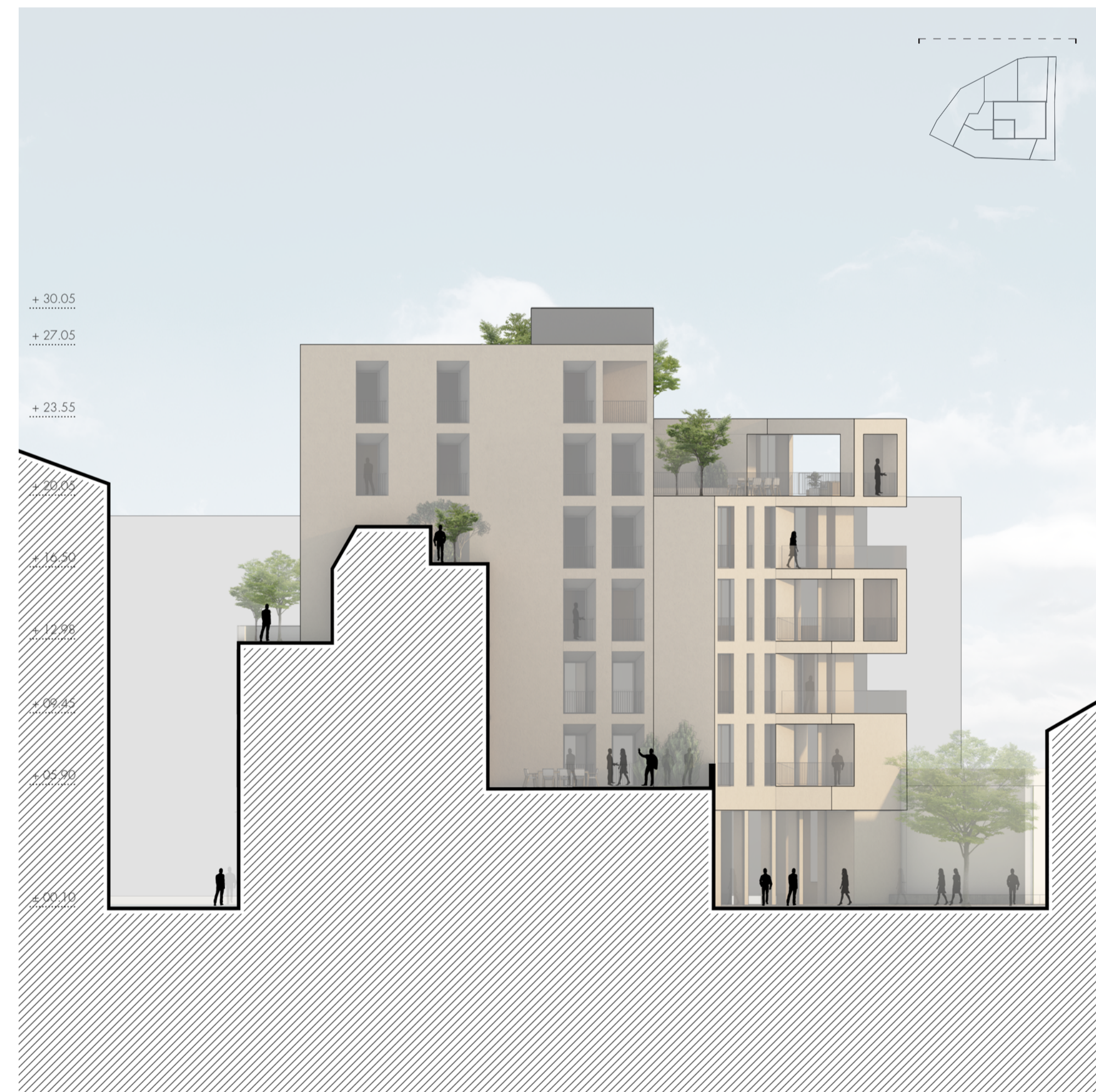
Prospetto nord 1:200