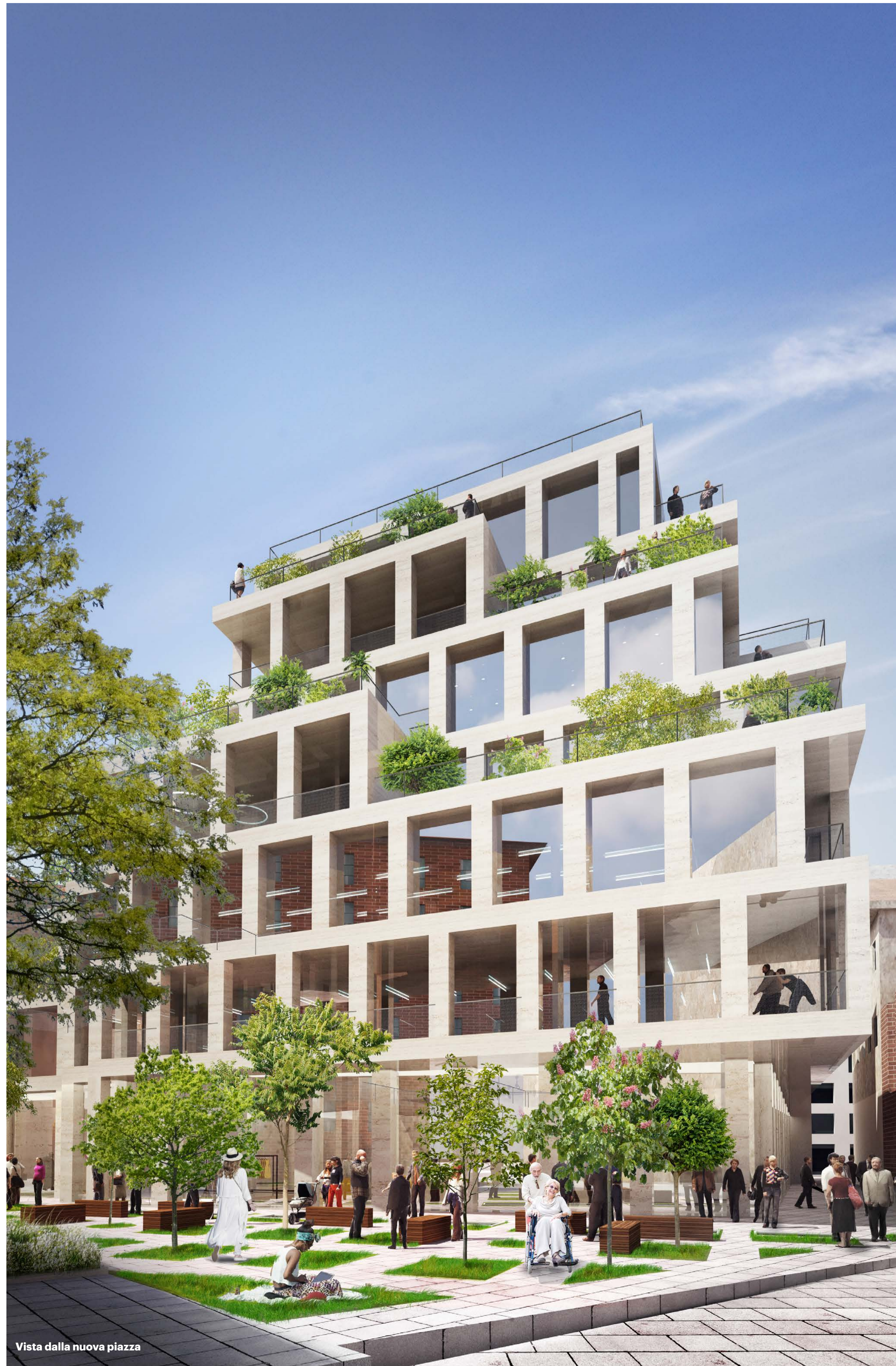
Vista dalla nuova piazza