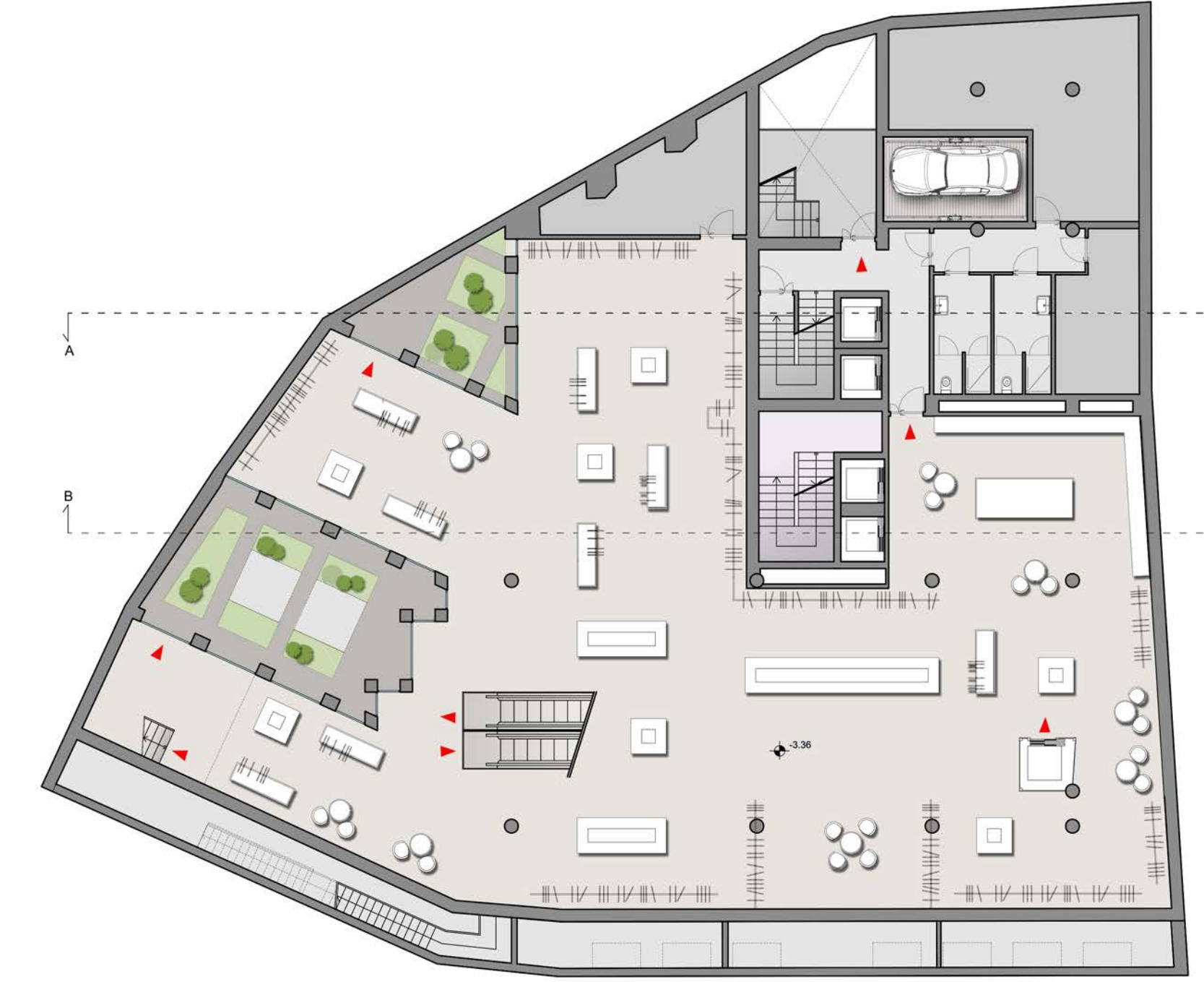
🕒 Piano -1 1:200 Lo spazio commerciale si articola intorno alla scala mobile e a due spazi verdi

■ commerciale 714,30 m2 cortili interni 70,76 m2