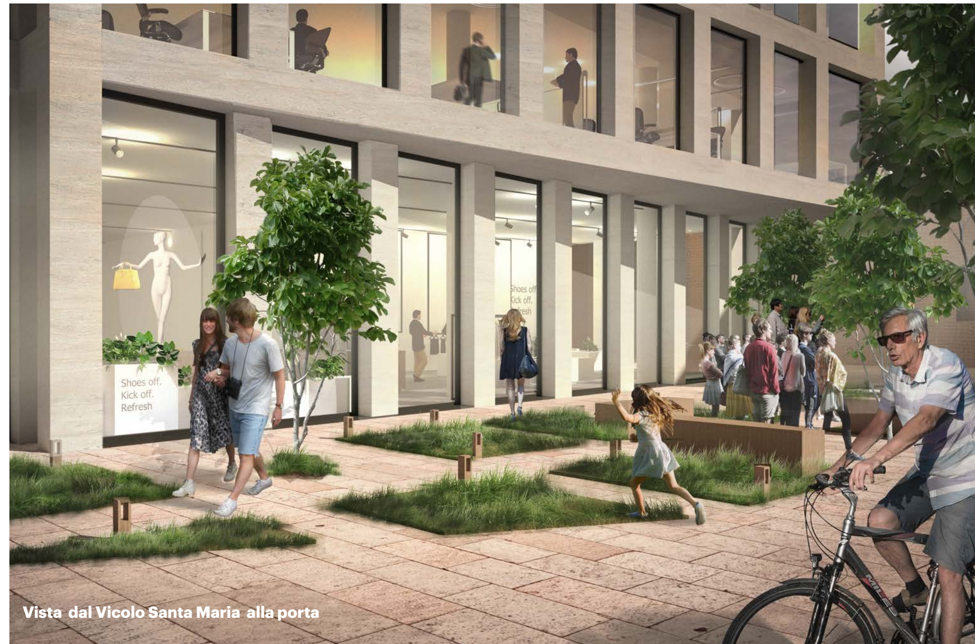
Vista dal Vicolo Santa Maria alla porta