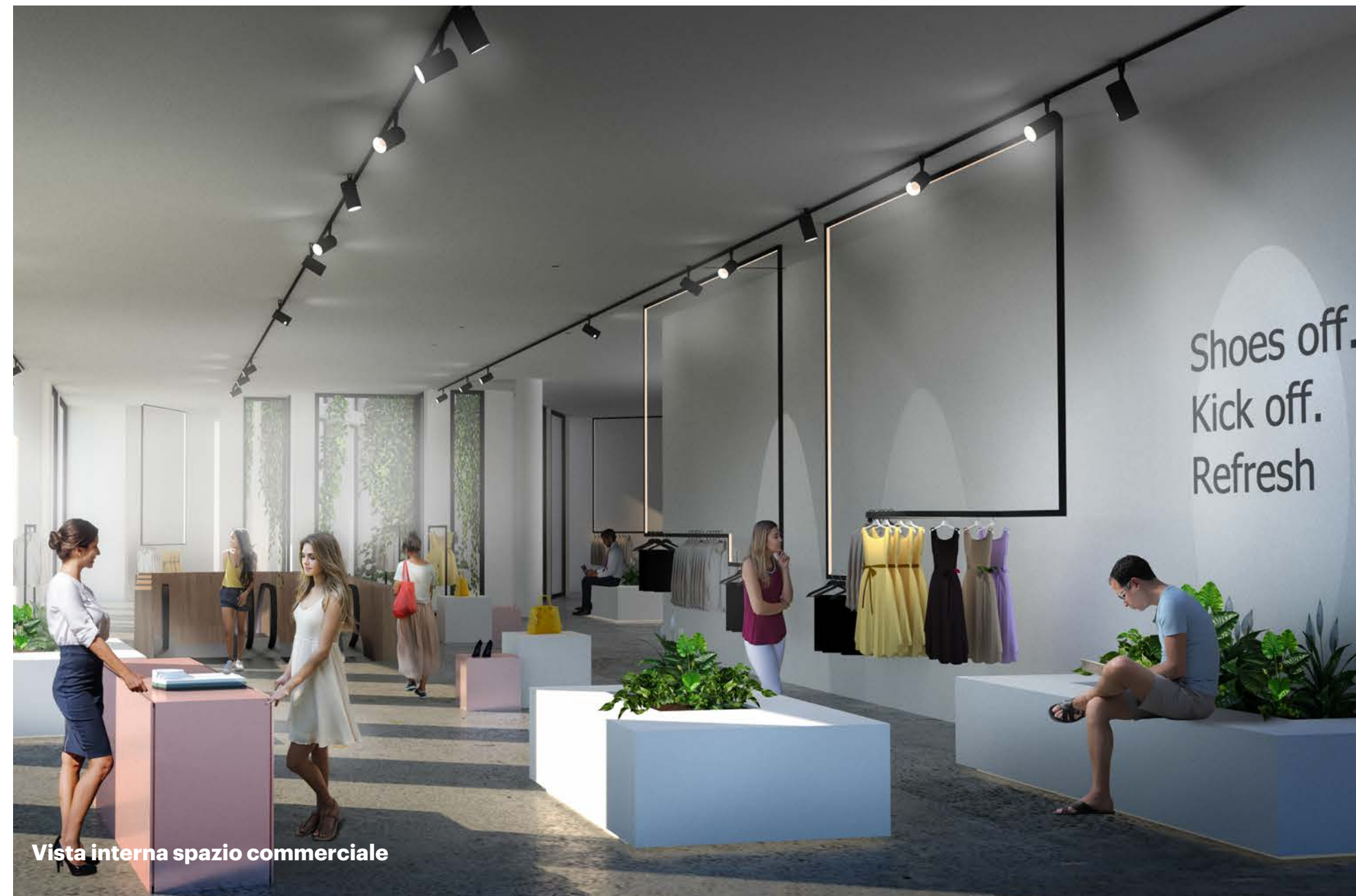
Vista interna spazio commerciale