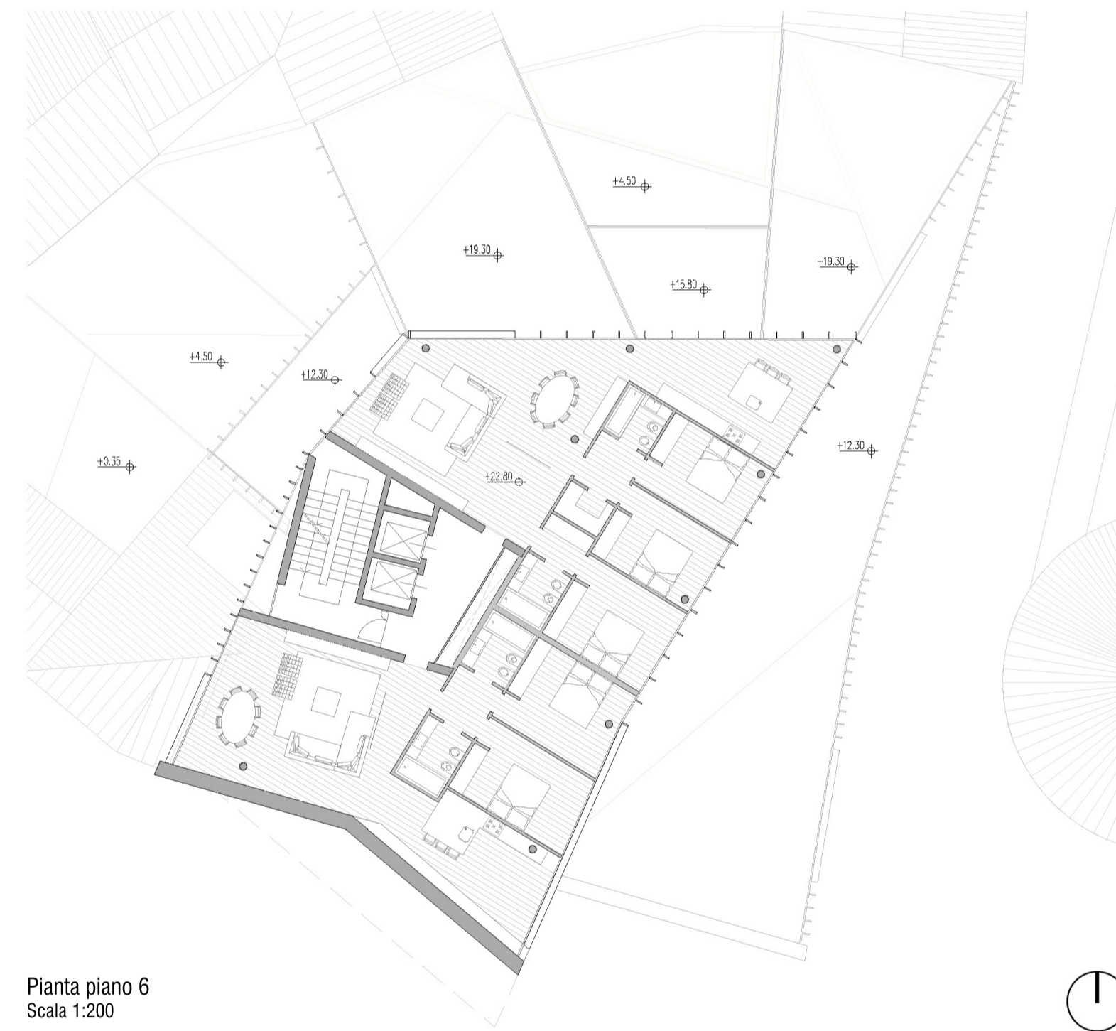
Pianta piano 6 Scala 1:200