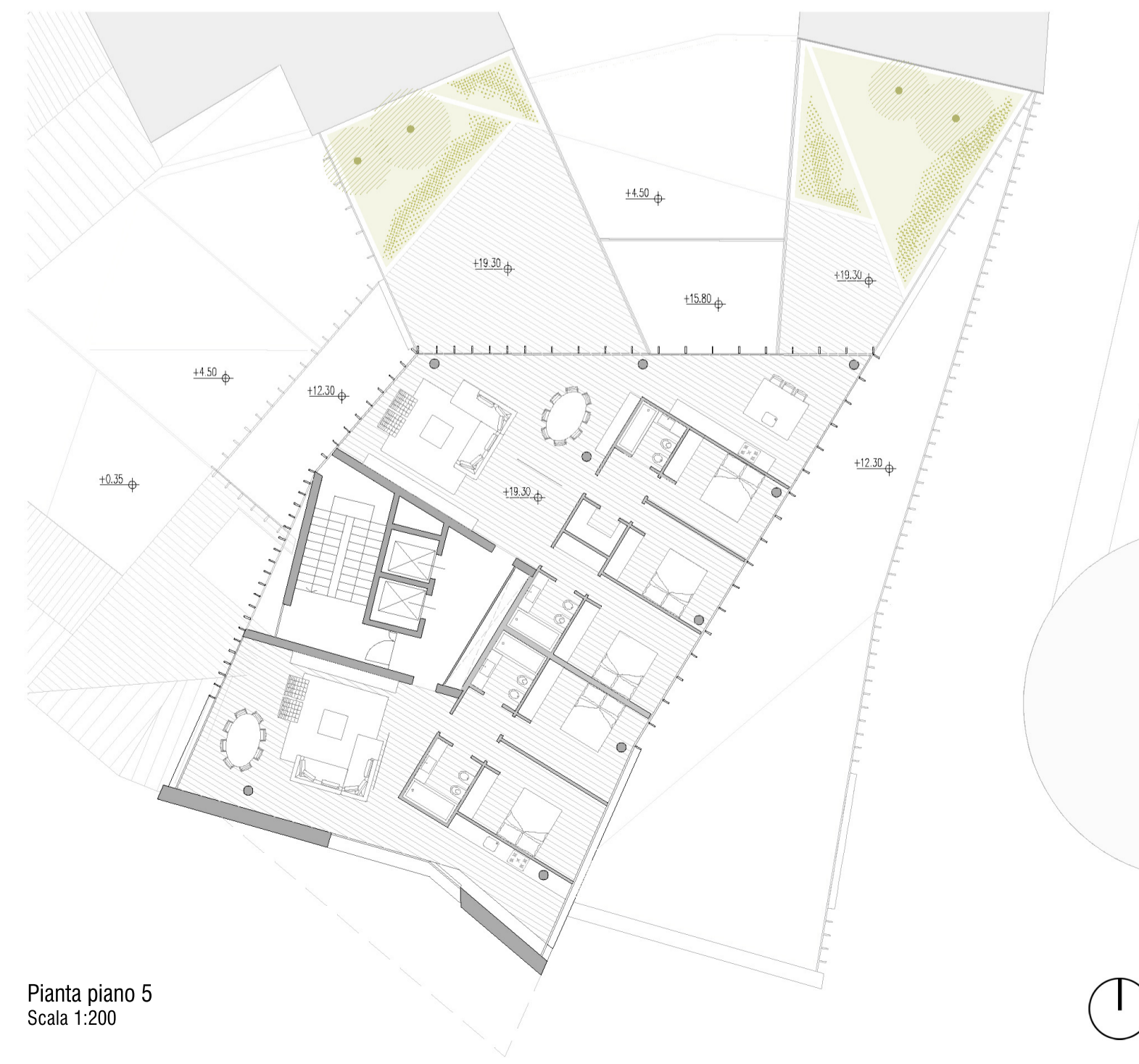
Pianta piano 5 Scala 1:200