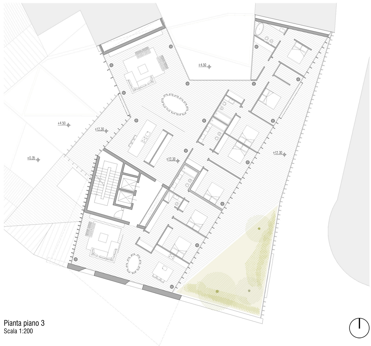
Pianta piano 3 Scala 1:200