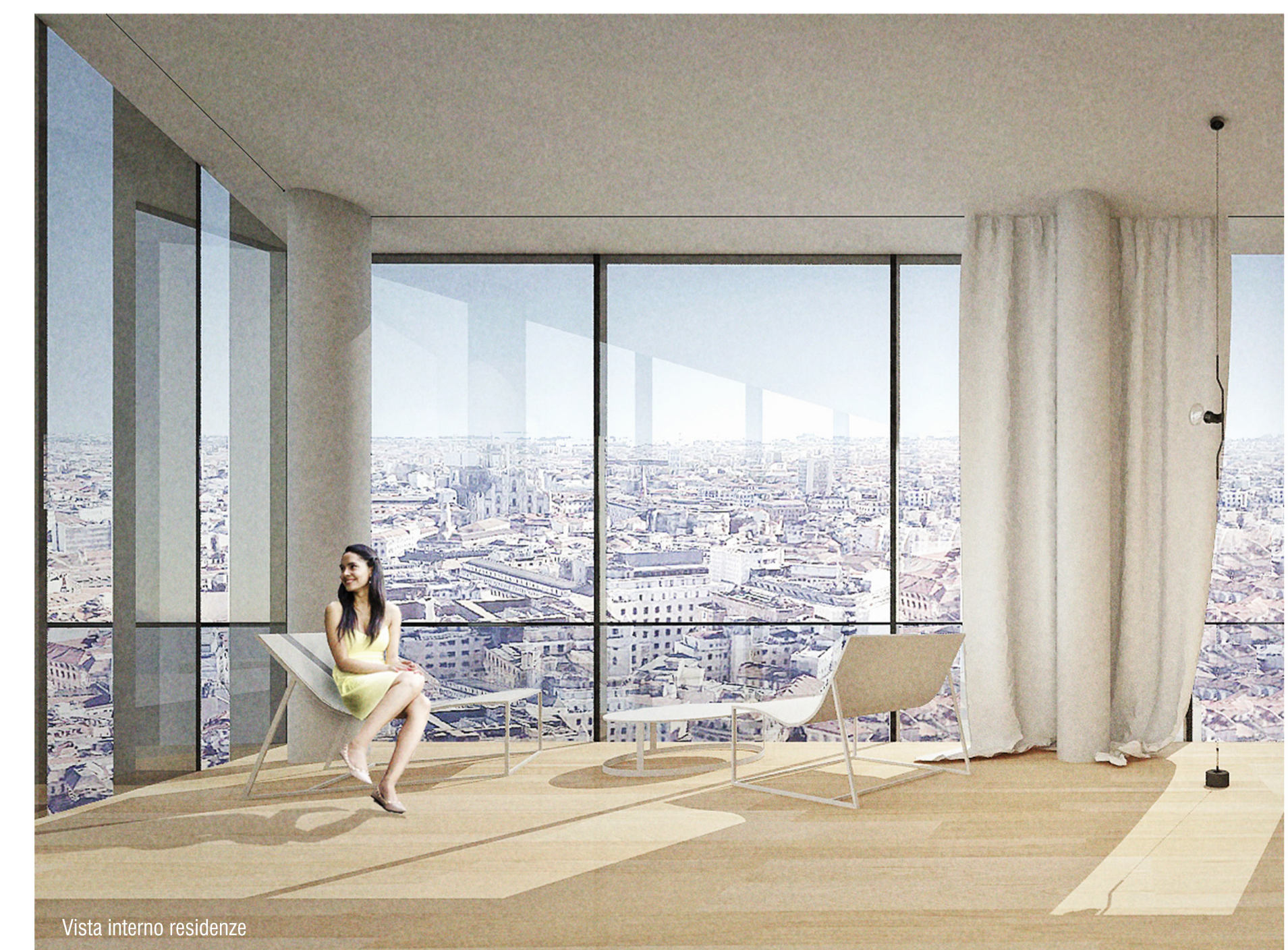
Vista interno residenze

Per quanto riguarda le scelte relative al linguaggio utilizzato la scelta di fondo è stata quella di unificare il trattamento dei fronti generati dalle sottrazioni di volume utilizzando facciate continue in vetro e acciaio. Tali facciate, arricchite da lamelle verticali in acciaio poste in posizione fissa ortogonale alla facciata, disegnano sulla stessa un ritmo variabile che si addensa e si dirada diversamente, secondo le diverse esigenze funzionali degli spazi a cui fanno riferimento (rispettivamente uffici e residenza), o in relazione alla volontà di individuare dei punti di vista privilegiati. Ne scaturisce una partitura che contribuisce ad identificare un armonico disegno di facciata finalizzato anche a mitigare la scala dell'intervento con il contesto, eterogeneo, presente.