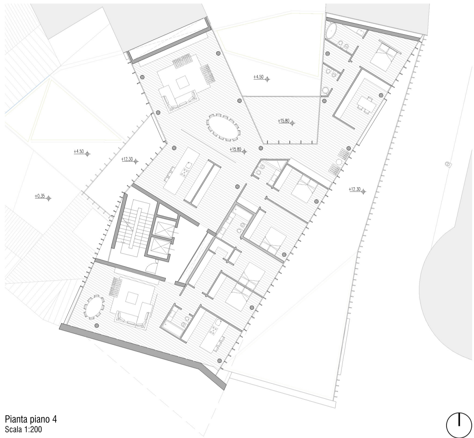
Pianta piano 4 Scala 1:200