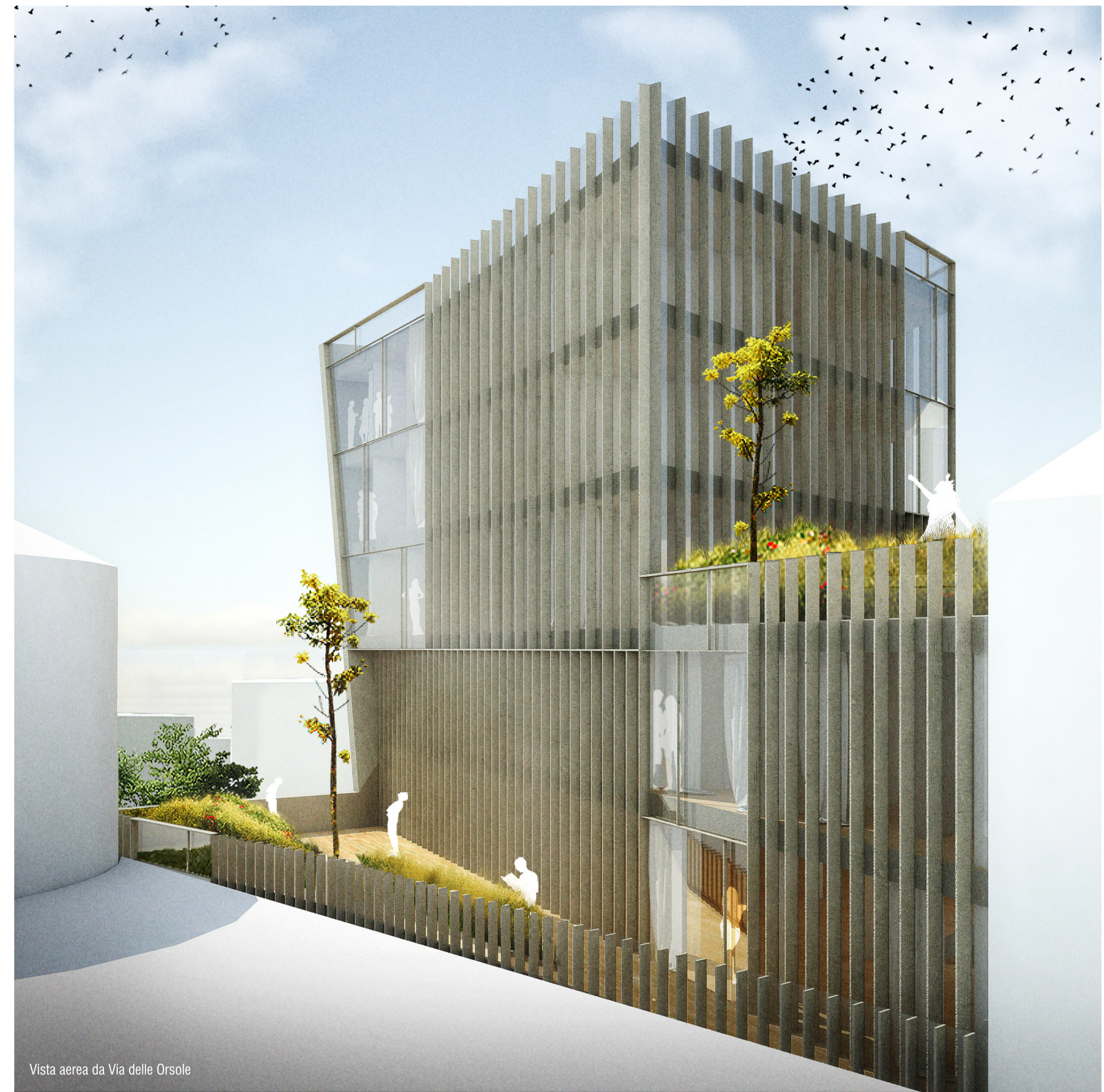
Vista aerea da Via delle Orsole