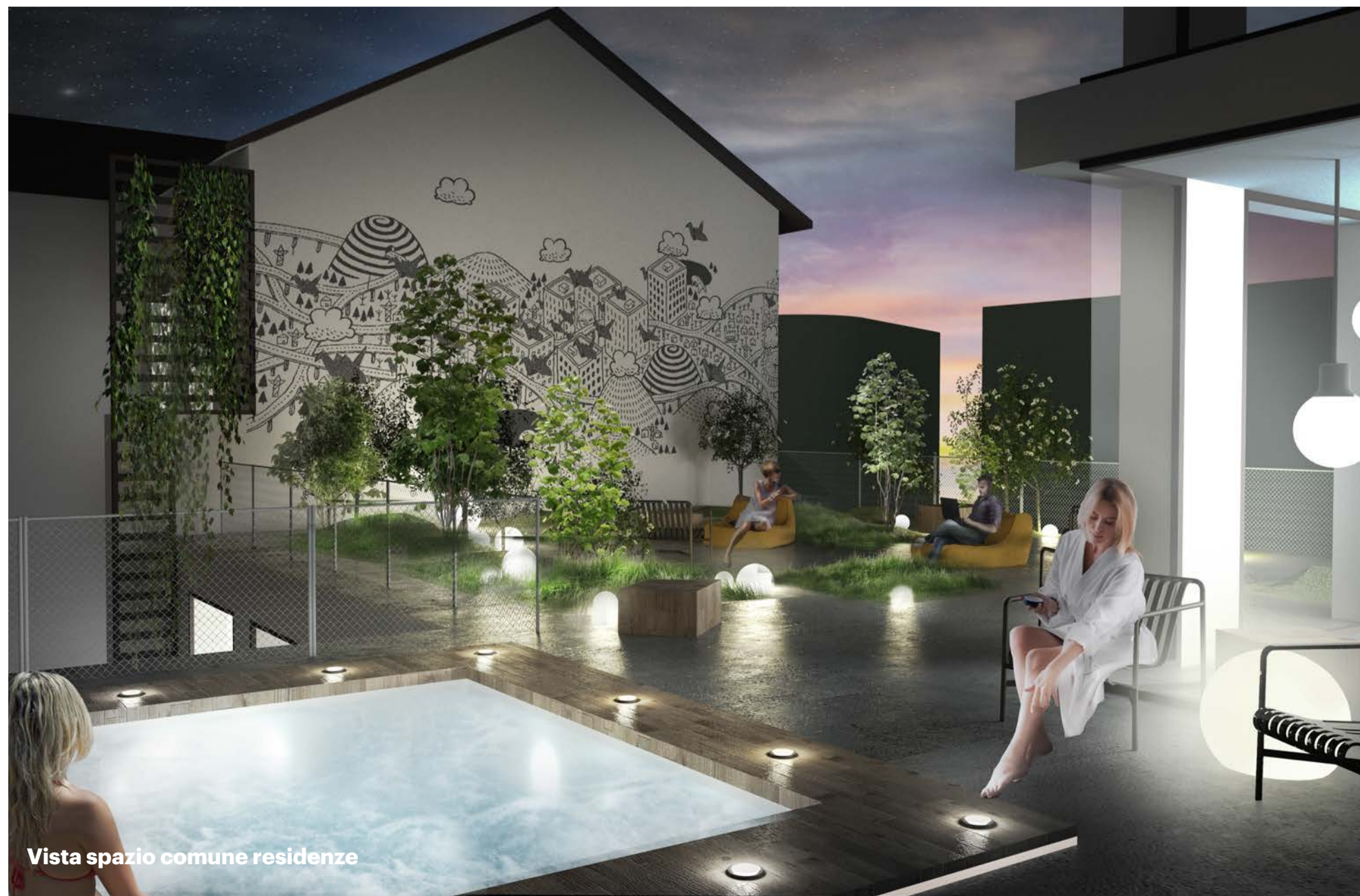
Vista spazio comune residenze