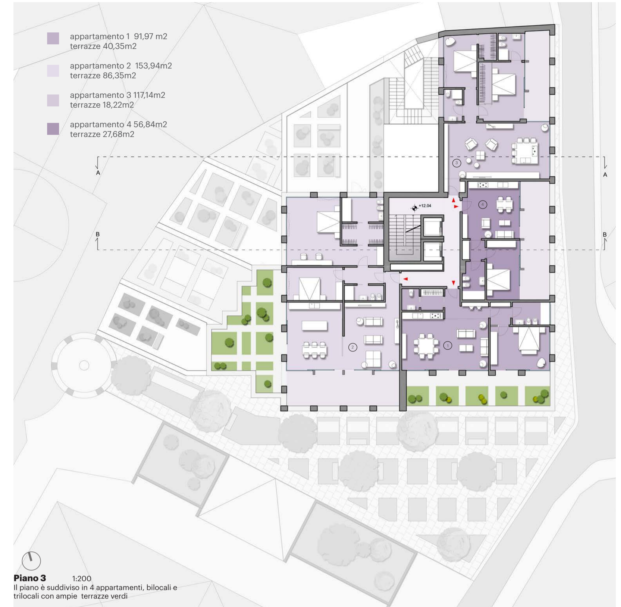
Piano 3 1:200 Il piano è suddiviso in 4 appartamenti, bilocali e trilocali con ampie terrazze verdi