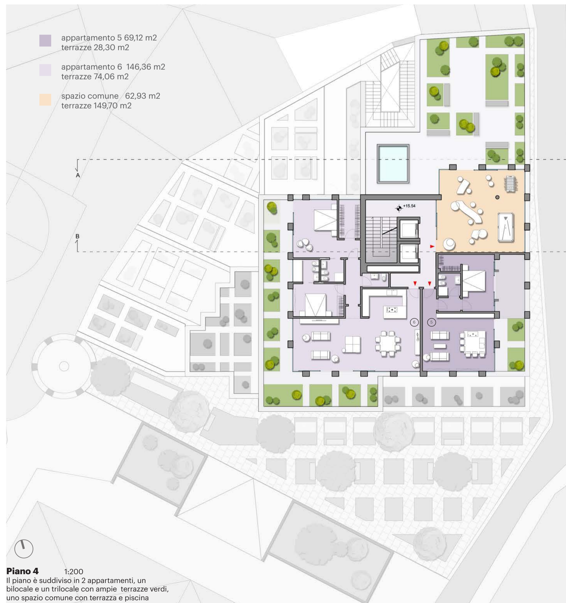
Piano 4 1:200 Il piano è suddiviso in 2 appartamenti, un bilocale e un trilocale con ampie terrazze verdi, uno spazio comune con terrazza e piscina