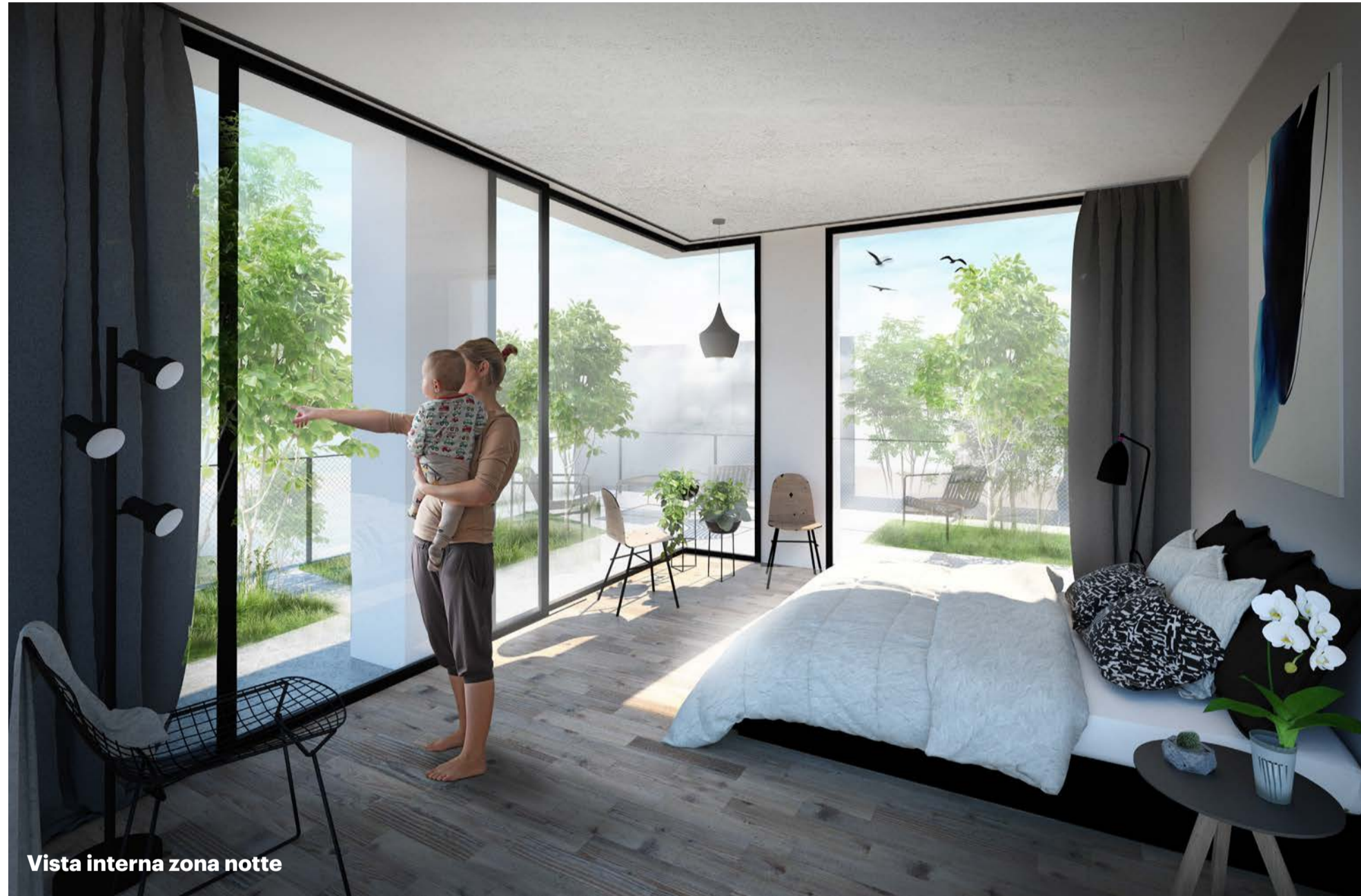
Vista interna zona notte