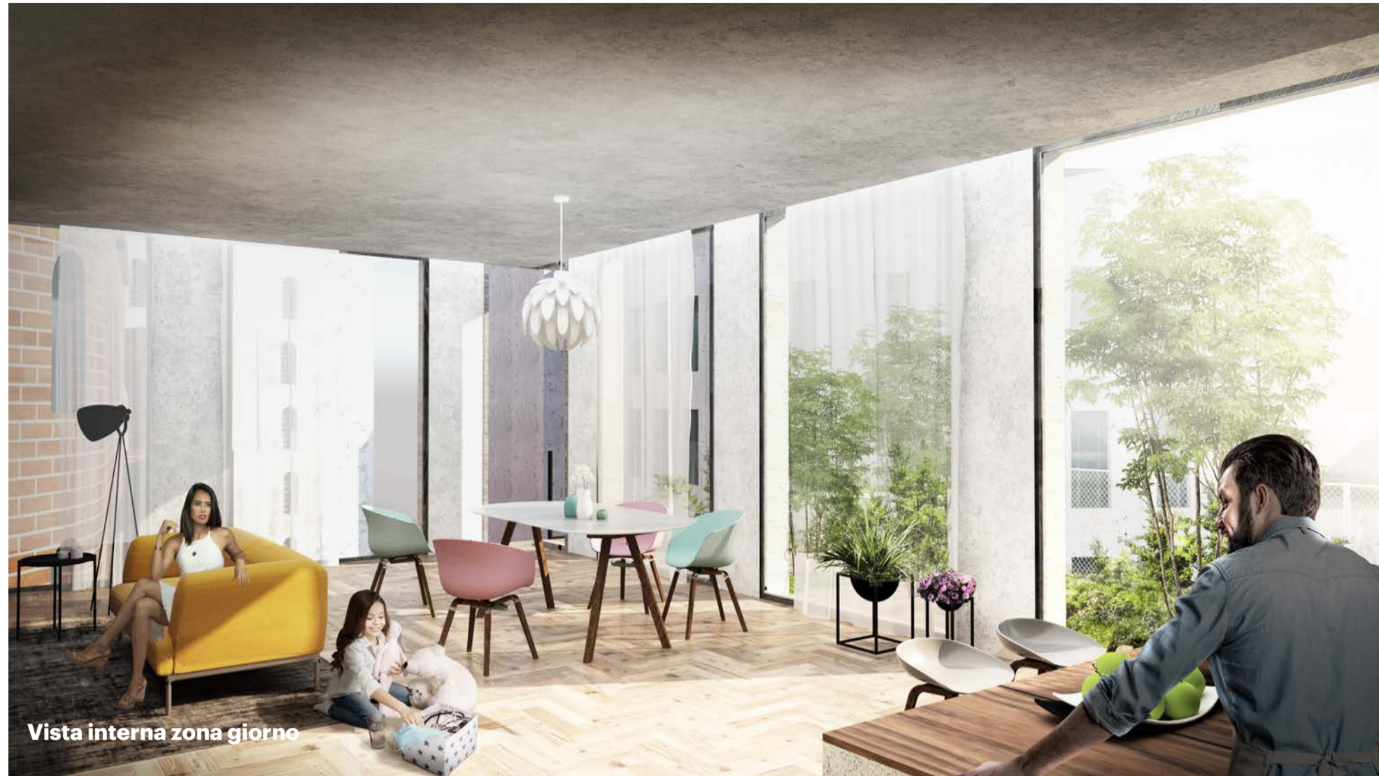
Vista interna zona giorno